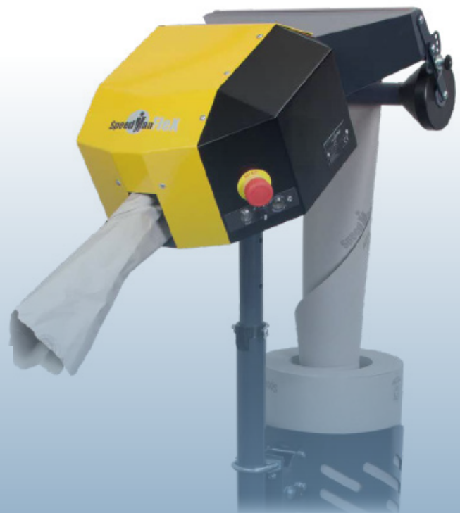
Table Stand - Vr.nr.: M70-237-301-0006